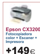
Epson CX3200 Fotocopiadora color + Escaner + Impresora