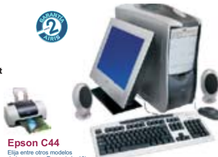
Epson C44 Elija entre otros modelos de impresoras Epson (pág.12)