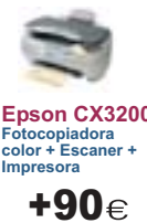
Epson CX3200 Fotocopiadora color + Escaner + Impresora +90€