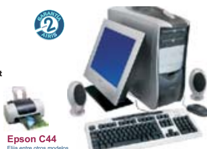
Epson C44 Elija entre otros modelos de impresoras Epson (pág.12)