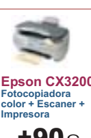
Epson CX3200 Fotocopiadora color + Escaner + Impresora +90€