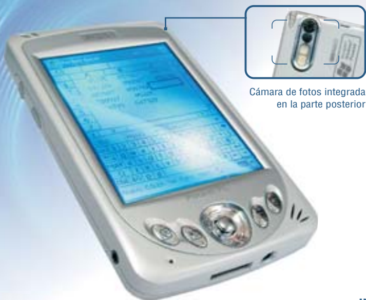
Cámara de fotos integrada en la parte posterior