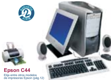
Epson C44 Elija entre otros modelos de impresoras Epson (pág.12)